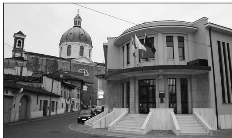
La nuova sede dei Vigili Urbani. Attenzione al senso unico e ai divieti di sosta: la multa è in agguato.