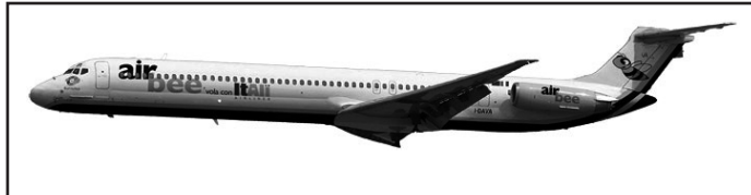
Aereo Boeing MD82 della ItAli Airlines sponsorizzato da Air Bee.

che effettuerà i voli e che già opera su Roma, Milano, Torino e la Sardegna. Il programma prevede due voli giornalieri su Roma (andata e ritorno) ed uno su Napoli. Air Bee ha inoltre aderito a Fly to Italy < http://www.trawel.com/index.php?option=com_content&task=view&id=232&lang=it >, il progetto incoming di Trawel