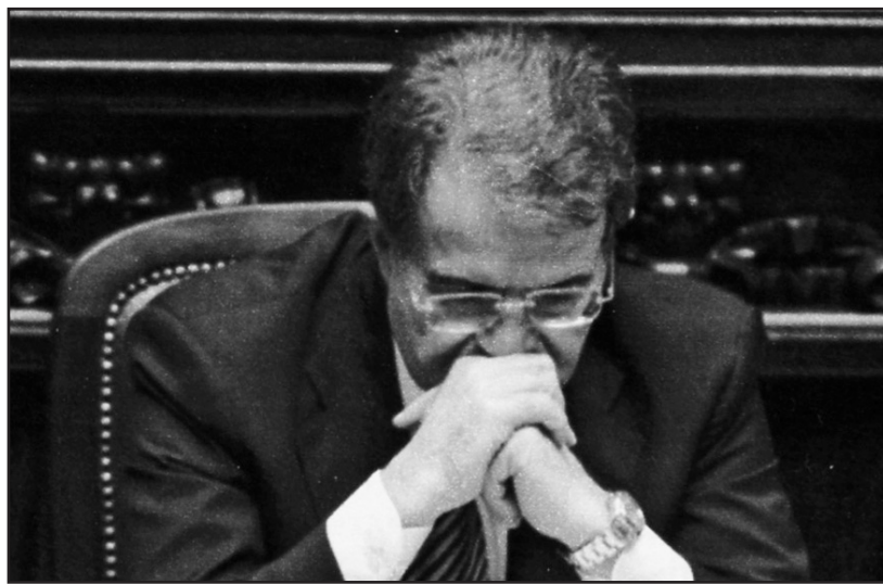
Romano Prodi, presidente onesto e non populista, sfiduciato dal Senato.

I rappresentanti del popolo italiano, intanto, nelle sedi parlamentari dove nacque con grandi e nobili intese di parti politiche la nostra bella Costituzione, si azzuffano volgarmente, si sputano e si minacciano, mentre altri, ancora più volgarmente, stappano champagne per festeggiare la caduta di Prodi, presidente onesto e non populista che voleva coraggiosamente guardare avanti con un governo dove ha messo tutto il suo tenace impegno per avviare ordine nell'azienda Italia, depredata dagli interessi particolari e personali dei precedenti governanti, e che prima o poi avrebbe messo le mani sul conflitto di interessi e sull'emittenza radio-televisiva.