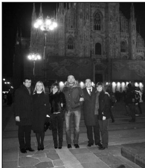
Gli amici presenti all'inaugurazione con lo sfondo del Duomo di Milano.