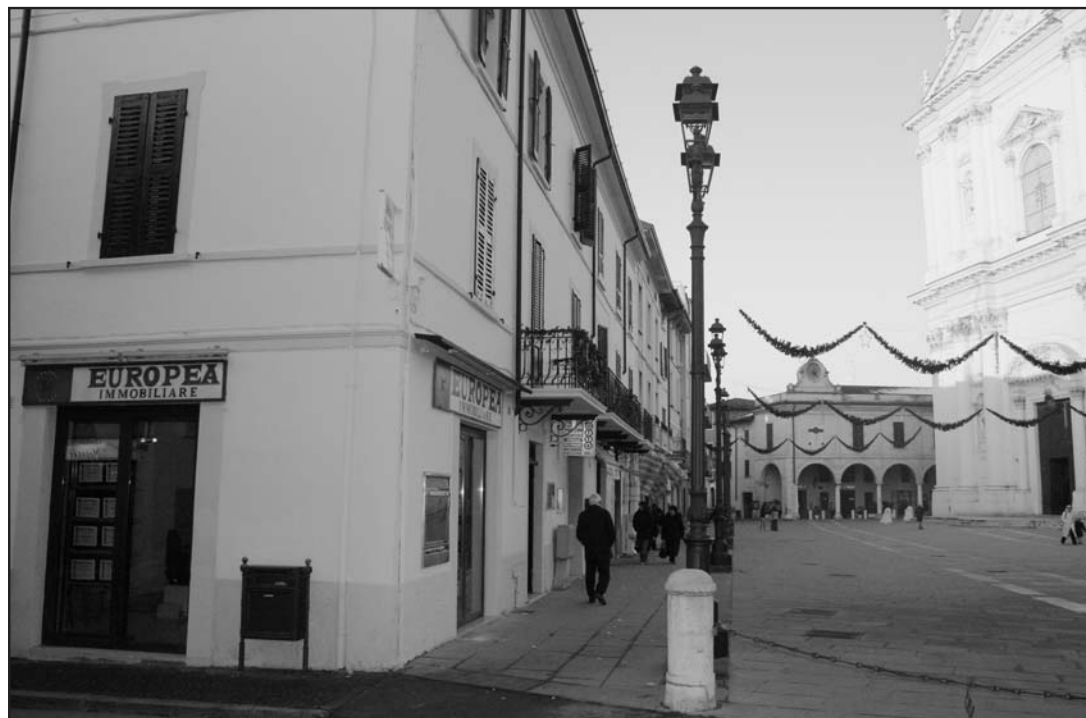
La Sede in Piazza S. Maria 1 - 25018 Montichiari (BS)