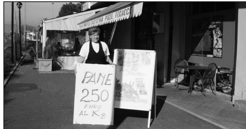
Febbraio, il mese del pane in offerta al negozio L'ARTE DEL PANETTIERE in via G. Marconi, 67.

Per informazioni tel. 030 8365271 - Cell. 393 6011743.